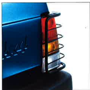
Fari protetti sulla versione 4x4, con le griglie originali Lineaccessori Fiat.

Fiat Panda è uno spirito libero: diversa da tutte, è fiera di essere identica a se stessa. Disinvolta e agile nella linea, va dritta all'essenza della guida. Una forza di carattere che si fa notare già nella versione Young, per completarsi via via di dettagli funzionali e rigorosamente di serie sulla Hobby e sulla Trekking; come