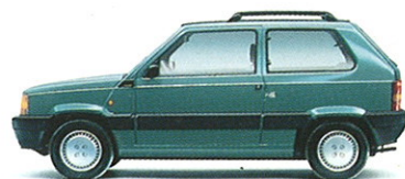
PANDA JOLLY Moteur 899 cm 3 , 39 ch. Vitesse maximale 135 km/h.