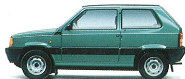
PANDA 4x4 Moteur 1108 cm 3 , 50 ch. Vitesse maximale 130 km/h.