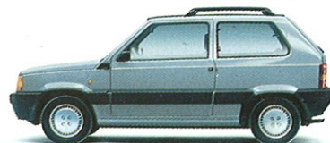
PANDA SELECTA Moteur 1108 cm 3 , 50 ch. Vitesse maximale 140 km/h.