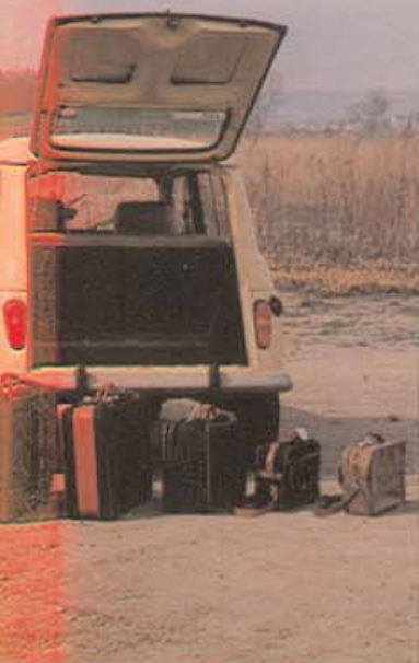
ise im Kofferraum Platz findet,