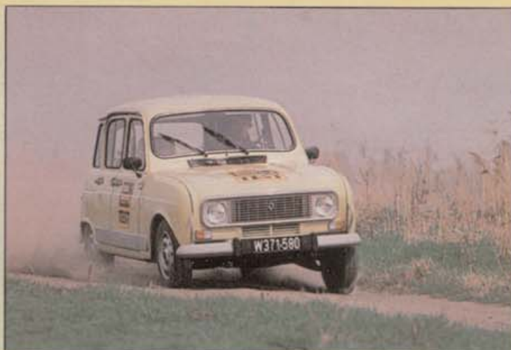
Als etwas unwillig erweist sich der stark untersteuernde R 4 in Kurven