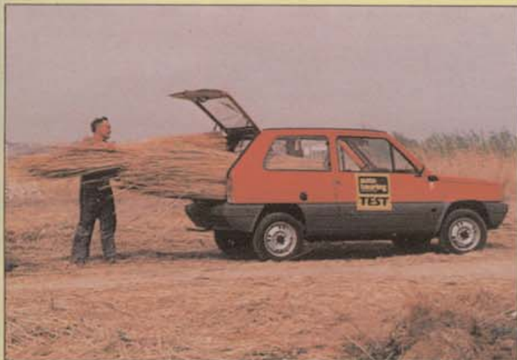
Zur Not läßt sich der Panda auch als Lastesel umfunktionieren, erstaunlich, was der kleine Italiener zu schlucken imstande ist