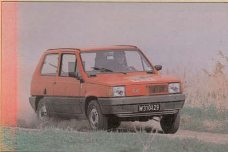
Mit seinem Go-Kart-ähnlichen Handling ist der Panda der Sportlichste