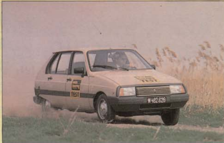
Angenehm und nur wenig untersteuernd verhält sich der Visa in Kurven

schafft der Renault 4 GTL ebenfalls 400 kg Zuladung. Die extrem weiche Torsionsstabfederung (längsliegend vorne, querliegend hinten) quitiert allerdings die volle Zuladung mit ziemlich starkem Einsinken hinten. Auch in Kurven legt sich der R 4 GTL für Außenstehende gefährlich ins Zeug. Als Lenker merkt man hauptsächlich an den steigenden Lenkkräften, wie stark der R 4 nach außen drängt. Insgesamt gibt er sich eher kurvenunwillig, untersteuert sehr stark, und es fällt ziemlich schwer, schnell und sauber um Ecken zu fahren. Dazu kommt noch als weiteres Minus, daß das Lenkrad auch nicht gerade griffgünstig ist. Für schnelle Richtungswechsel liegt es nicht sehr gut zur Hand. Überragender Eindruck beim Renault 4 GTL ist dessen ausgezeichnete Fahrkomfort, der selbst schlechteste Feldwege auf ein sanftes Dahingleiten reduziert. Kein Wunder, daß sich der Renault 4 gerade in den ehemaligen Kolonialländern besonderer Beliebtheit erfreut, gute Straßen zählen dort ja nicht gerade zu den Selbstverständlichkeiten. Und das robuste Fahrwerk verdaut selbst Wüstenpisten anstandslos.